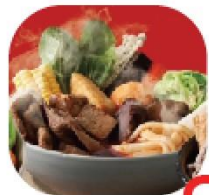
妙語如豬 NT 95 Pork Set Meal