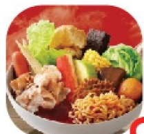
牛刀小試 NT 99 Beef Set Meal