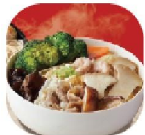
小資蔬食 NT 81 Budget Vegetarian Set Meal