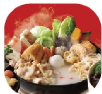
麻辣招牌 NT 99 Spicy Signature Set Meal