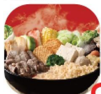
神雞妙算 NT 95 Chicken Set Meal