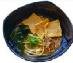
柴魚韓式魚板湯烏龍麵 Katsuobushi Udon(Fish cake)