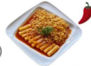
辣炒年糕炒泡麵 Rabokki(ramen + tteokbokki)