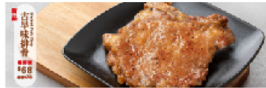
湯麵 Noodle Soup タンメン

古早味湯麵 Traditional Style Noodle Soup 45元 昔ながらの台湾式ラーメン