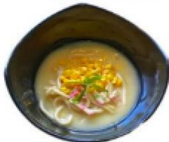
玉米濃湯烏龍麵 Corn Soup Udon