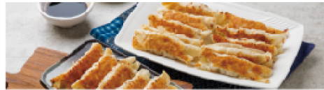
金牌牛肉系列 BaFang Beef Meals クラシック牛肉スープ商品

紹辣乾麵 Noodles with Spicy Mince 60元 激辛汁なし麵