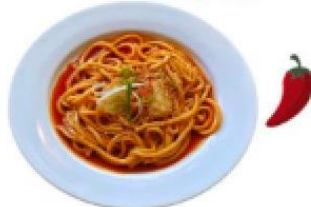
韓式泡菜辣拌烏龍麵 Spicy Kimchi Udon