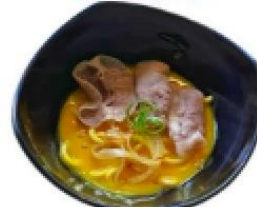
咖哩豬肉烏龍麵 Curry Udon(Fork slices)