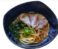
柴魚豬肉湯烏龍麵 Katsuobushi Udon(Fork slices)