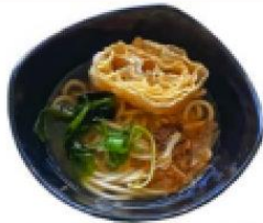
柴魚豆皮湯烏龍麵 Katsuobushi Udon(Tofu skin)