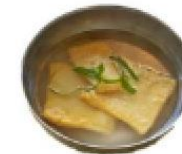
韓式魚板湯 Korean Fish cake Soup