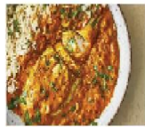
咖哩烤雞飯 + 當日特配

Curry Grilled Chicken Rice + Today's Special