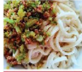
清真羊肉芝麻 拌麵 + 當日特配

Halal Lamb with Sesame Noodles + Today's Special