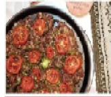
咖哩烤雞肉丸飯 + 當日特配

Curry Grilled Chicken Ball Rice + Today's Special