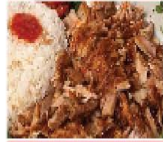
沙威瑪飯 + 當日特配