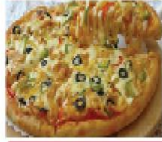
中東雞肉薄餅比薩