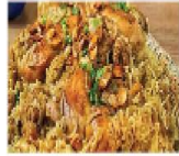
花菜倒扣雞肉飯 + 當日特配

Cauliflower Chicken Rice + Today's Special