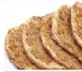
中東雞肉薄餅麵包