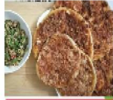
中東牛肉薄餅麵包