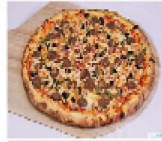
中東牛肉薄餅比薩