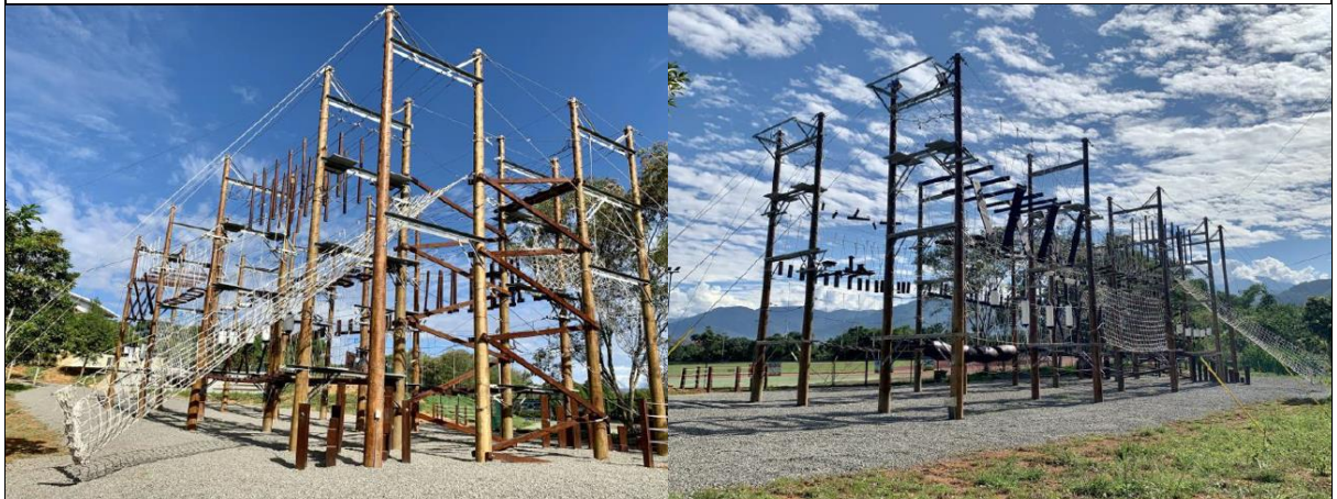
中高空探索教育設施模組現場狀況

另本案場位於執行機關西側，該側設施為餐廳區、圖書館、學生宿舍及體育館，基地係座落於體育健康中心及操場間，為學生進行戶外活動之主要場域，案場內設置約40項中高空探索設施與6項低空設施，並有辦公室及儲物室等附屬設施；此外，如前述因基地鄰近體育健康中心及操場等體育設施，故亦適合作為執行機關辦理相關活動之場地。