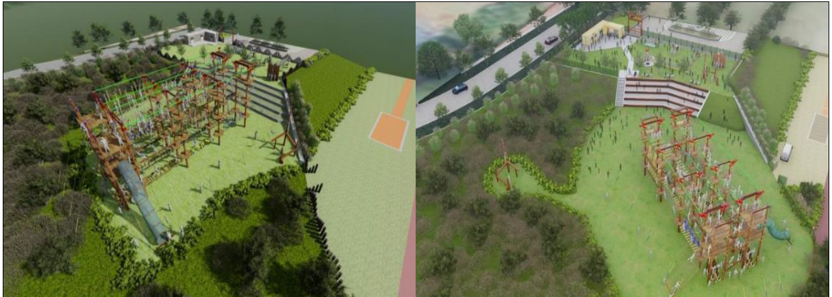
本案場全區示意圖