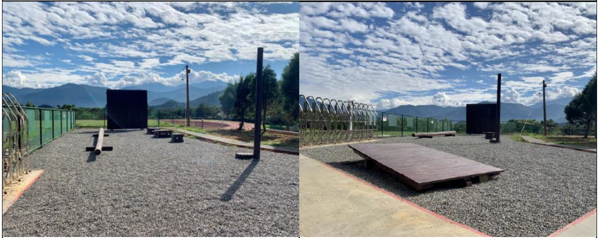
低空探索教育設施模組現場狀況